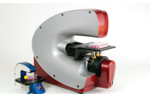
HoloMonitor M4 och HoloMonitor M3

"The HoloMonitor gives a totally new dimension to our work."